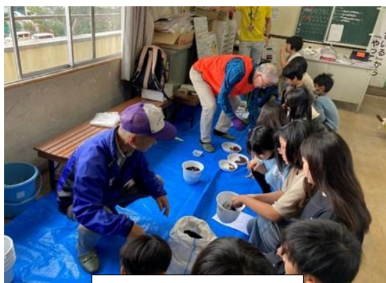
どんぐりプロジェクト