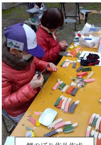
鯉のぼり作品作成