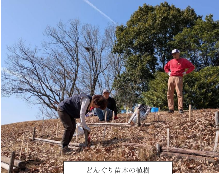
どんぐり苗木の植樹